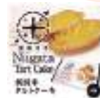
【新潟】 新潟米タルトケーキ