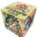
【福井】 恐竜ふりかけ