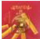
【石川】 いもんどけえき