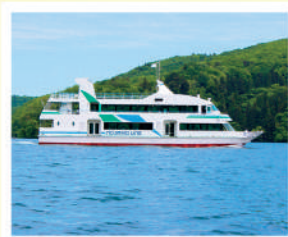
野尻湖一周遊覧船

注意事項 ブルーベリー収穫体験をします。 ハイキングのような靴、服装だと安心です。