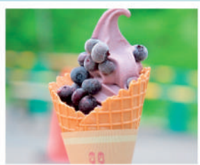
ブルーベリーソフトクリーム